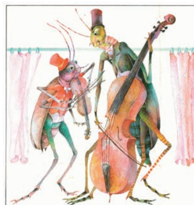
Ilustrácia: Dušan Kállay