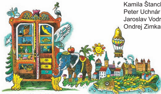
Ilustrácia: Martin Kellenberger