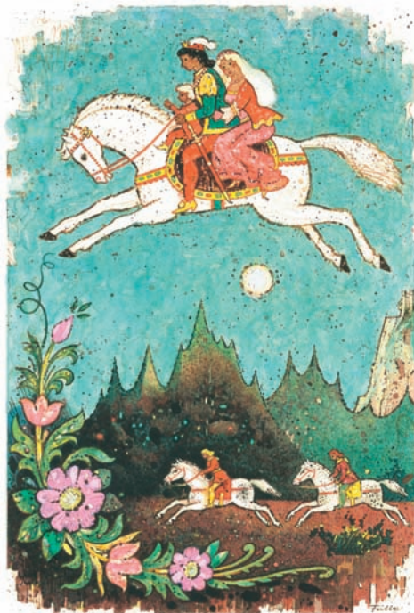
Ilustrácia: Ľudovít Fulla