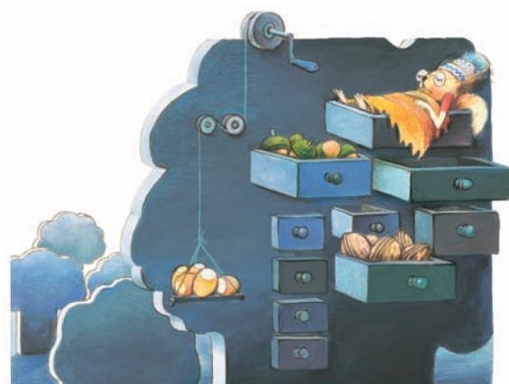
Ilustrácia: Peter Čisárik