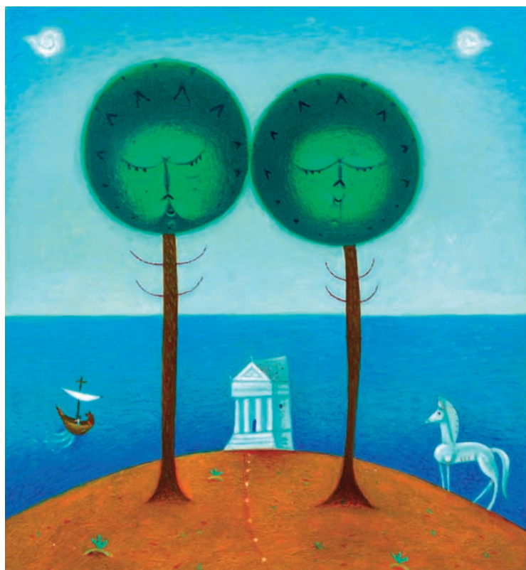
Ilustrácia: Miloš Kopták