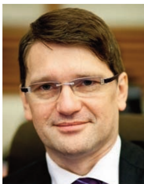
Marek Maďarič, minister kultúry SR