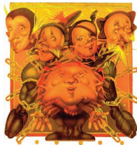
Ilustrácia: Robert Brun