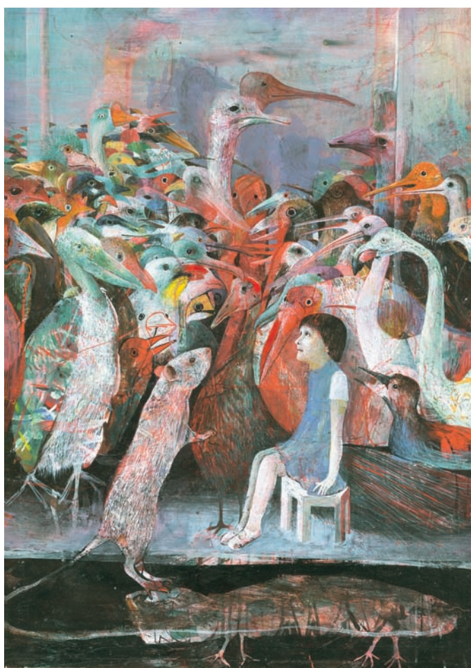
Ilustrácia: Dušan Kállay

Biblioteca Comunale Deli Archiginnasio, Piazza Galvani 1, Bologna