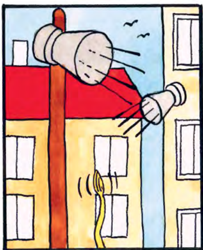
Miestny rozhlas hlási: „Z cirkusu utiekol lev! Kto ho zbadá, nech najprv utečie, a potom zatelefonuje na číslo 00001.“