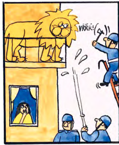
Prihrmeli požiarnici, striekajú na balkón. Aj slzotvorné bomby hádžu, takže plače celá ulica.