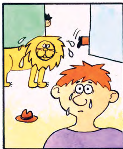
Z domu vybehol dlhovýslý mládenec. Zlatú hrivu má zmoknutú. Jojo plače od slzotvorného plynu aj od hanby. To je strašné, čo môže spôsobiť strach!