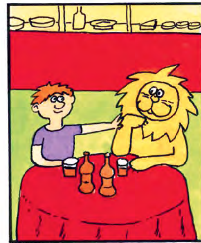
Všetci zutekali, iba Jojo sedí s levom v cukrárni. Lebo tak je to na svete: KTO SA NEBOJÍ, S TÝM SA AJ LEV SKAMARÁTI!